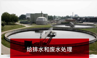
给排水和废水处理

一个强大的业务模型不依赖于针对少数客户/行业的大型项目，而是销售少量产品给许多行业和客户（涵盖许多应用）。